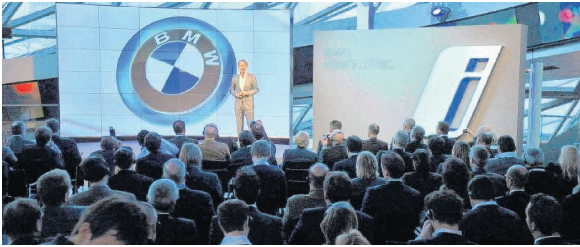
BMW-Chefdesigner Adrian van Hooydonk präsentiert das Logo der neuen Submarke BMW i: das herkömmliche BMW-Logo mit einem zusätzlichen äußeren blauen Kreis.

Schäubles Sprecher verwies auf die neuen Bonusregeln, die mit dem Banken-Restrukturierungsgesetz erst mit Wirkung für 2011 gelten. Wirksame Regeln für solche Fälle gebe es erst seit Jahresbeginn. Die Ankündigung der Commerzbank beziehe sich auf Boni für 2010. Es gebe also keinen Verstoß gegen Vergütungsregeln des Restrukturierungsgesetzes. Danach werden die Gehälter aller Mitarbeiter in staatlich gestützten Banken auf 500 000 Euro pro Jahr begrenzt.